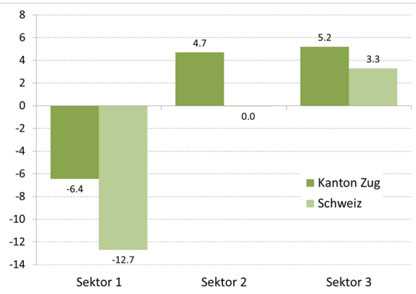
Sektorentwicklung Kanton Zug und Schweiz, 2008-2011, Beschäftigungsveränderung in % (provisorische Zahlen, 2008 ist eine Schätzung)

Quelle: Bundesamt für Statistik, STATENT